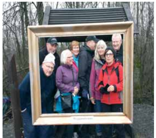
Bilder fra Myggmuseet