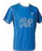
Blå - 1074