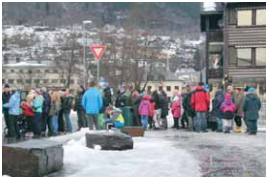
Køen vart lang