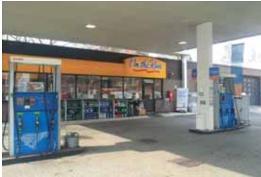
Start fra Esso "On the Run" i Storgata.

Ved siste årsskifte var det 4698 deltagelser i de to løypene. De som vil ha et minne om deltagelsen kan kjøpe et tøymerke med Hortensgasten Start og inntøst for begge