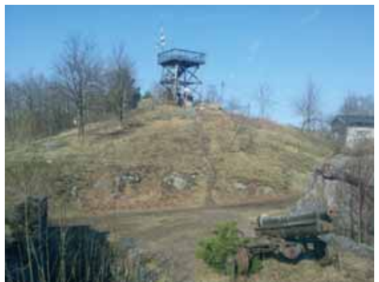
Mer av utsikten fra Bassenget. Her er Løvøya til venstre, så følger Mellomøya og Østøya.

Så kommer vi fram til festningen på Røreåsen (anlagt i 1903) med kanonene fremdeles på plass og med en kjempeutsikt fra det store utkikkstårnet, ta gjerne en tur opp !