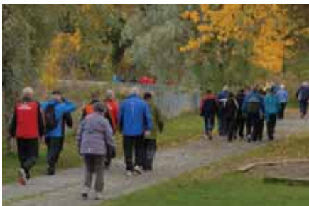
Start Foto Jan Arne Dammen