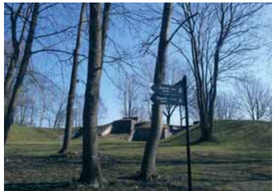
Fyllinga Batteri som nå brukes til sommereater

Grunnen til at kanalen kom var at Marinens hovedbase var flyttet hit i 1820 og man mente den gang at kanalen var nyttig for hurtig forflytting av skip fra Indre Havn. Kanalen ble utgravd med liten krumming i nordre ende slik at en tenkt fiende ikke kunne skyte direkte igjennom kanalen.