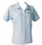
Lys blå 3039