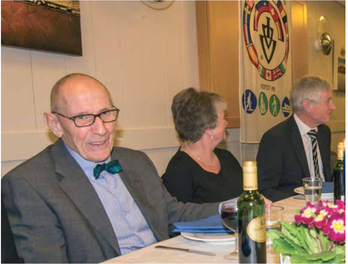
Æresmedlemmer til bords.

den ble tatt veldig godt imot, sannelig var det noen sultne overnattingsgjestene som fikk seg et kjøttmåltid der og da.