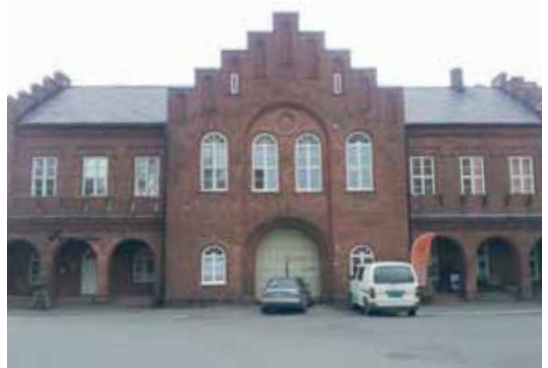
Den gamle Verftsporten huset tidligere Horten Tekniske Skole.

Ved tidligere "Sjømilitære Korps" svinger løypa mot Horten Kirke (Garnisonskirken fra 1855). På høyre side har vi den gamle "Verftsporten" som er fra 1866 - 1939 huset Hortens Tekniske Skole. På innsiden her lår "Verven" (Marinens hovedverft - senere Horten Verft - nå Horten Industripark.)