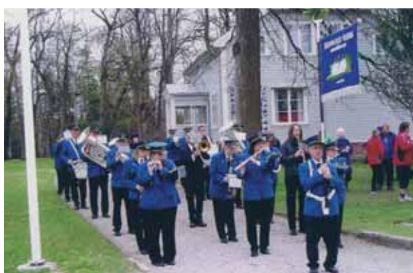
Eidsvold Verk Musikkorps spilte.