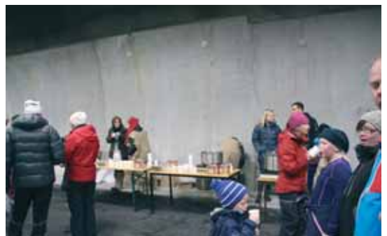
Servering i tunellen