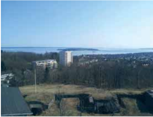
Utsikten fra toppen av tårnet på festningen. Her ser vi helt til Bastøy med byens høyhus i forgrunnen.