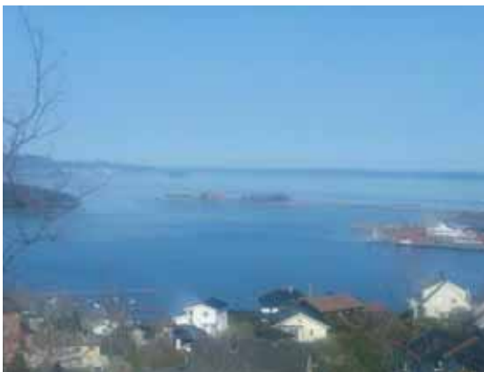
Utsikt fra Bassenget mot Vealøs med Karljohansvern til Høyre.

Løypa følger Indre Havn fram til Pluggen Småbåthavn, passerer Kongsberg-Simrad-