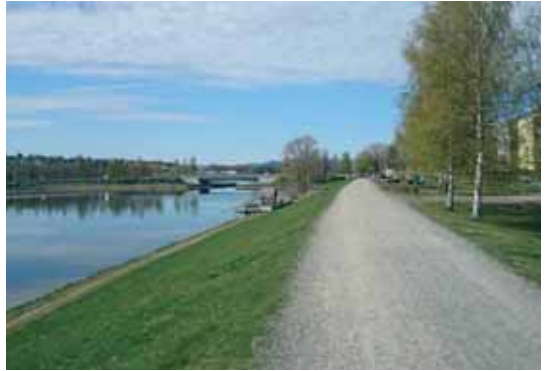
Langs Nitelva bak Elveparken boliger

side av elva og går til jernbaneundergangen. Herfra går vi samme løype tilbake til Havna båtforening.