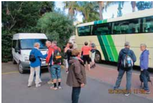
På vei til Funchal

en del barer som kunne besøkes. Etter frokost var det bytur til Funchal, med