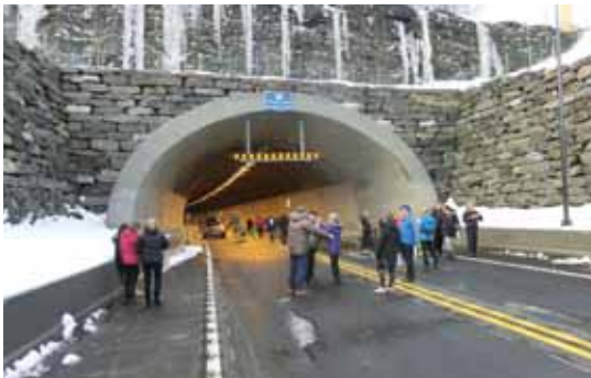
Apning i aust