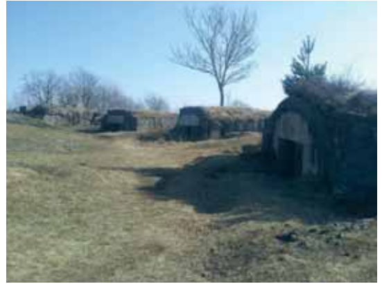
Fra Festningen- bygget for å lure svenskene i 1903

Så følger vi stien forbi Speiderhuset og gjennom skogen på Brårudåsen før vi kommer ned til bebyggelsen i Seljestien og derfra er ikke veien lang ned til utgangsstedet.