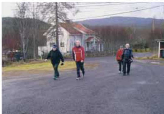
De første til mål.