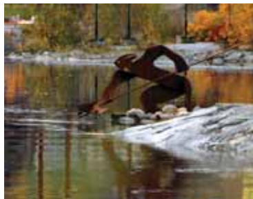
Kjerrakall'n i Steinkjerelva