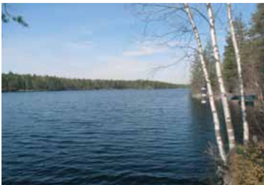
En annen av rasteplassene ved Dragsjøen.

Dragsjøen Turmarsjklubb starter også opp sommerserie fra tirsdag 24. juni – start 18.00