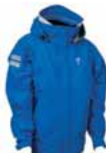
Blå - 4046