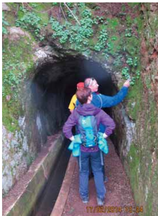
En liten tunell passeres

Siste gädagen kom med bra vær og dagens vandring var Mimosa levadaen Marocas, en vandring som var lett å gå. Vi ble kjørt frem til starten, og så var det bare å rusle av gårde. Levadaen snodde seg ut og inn i dalførene, meget sjarmerende var det. Tynnøyen var atter fremme, så nå viste Madeira seg igjen fra en god side. Det ble tatt en mengde med bilder. Selv om det var tidlig på året, var det masse flott