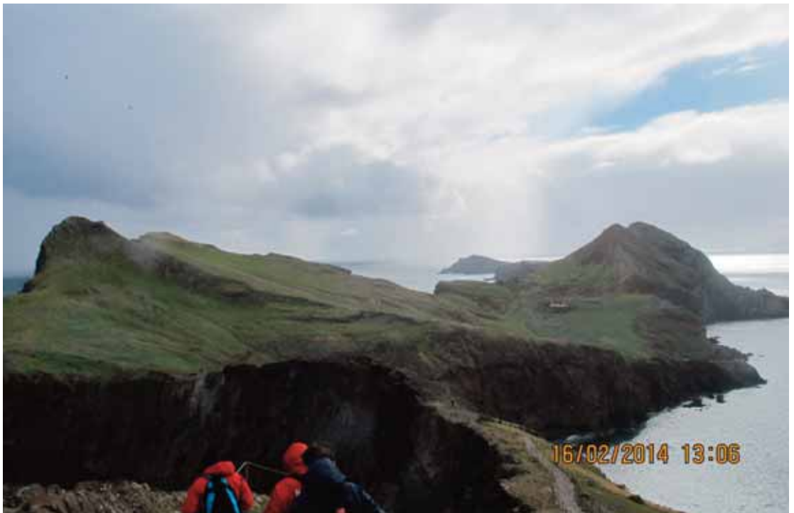
Flott landskap, vi skal på toppen i bakgrunn.

Etter middag og diverse kveldsrutiner var det klart for en ny dag. Denne dagen skulle vi ha fri, men de som hadde lyst, kunne bli med på vandring. Nesten alle ville med. Været var bedre, men fortsatt var det sterk vind. Turen gikk til det østligst punktet på Madeira, São Lourenço flott terreng meget