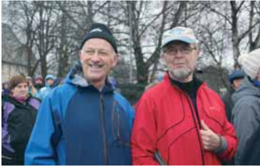
Men ingen sure miner