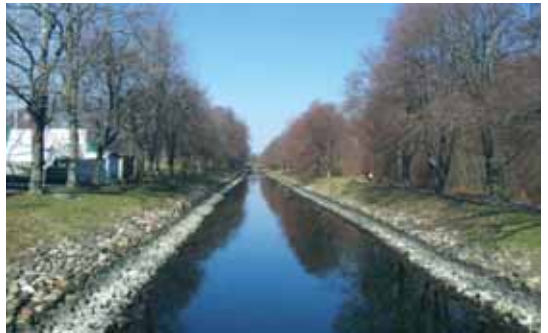
Den vakre Hortenkanalen, utgravd med håndkraft fra 1854 - 1867.

Etter starten på "On the Run" følger løypa Storgata ned til torvet, derfra forbi noen av byens kjøpesentre ned til havna, forbi turistkontoret og til småbåthavna Fyllinga. Krysser den 150 år gamle Hortenskanalen - utgravd med håndkraft i årene 1854-1867.