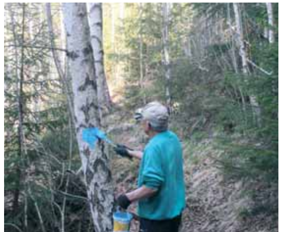
Merking av 11 km løypa - dugnadsinnsats må til.

6 og 11 km løypa inngår i et mer omfattende opplegg som innebærer at det underveis vil stå skilt som markerer historiske steder/begivenheter, natursti samt skilt som oppfordrer til ulike trimøvelser. Det etableres også flere flotte raste-/hvileplasser langs de 2 sjøene.