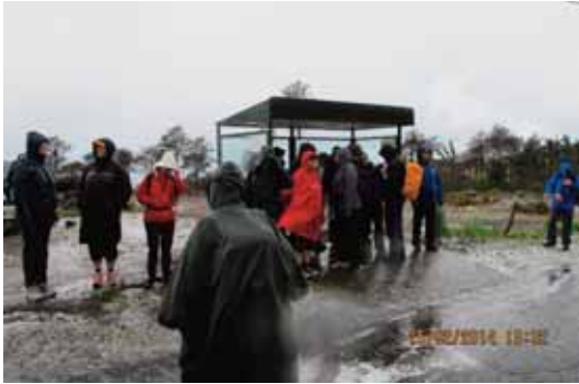
Regn og hagl