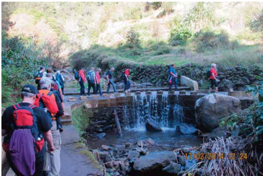
Vår siste levadavandring

kupert, men stiene var flotte å gå på. Det var opp til en topp, og ned og opp igjen, men du verden for et flott landskap. Vinden rev og slet i oss men vi gikk frem og tilbake med en kort spisepause med litt regn!! En fornøyd gjeng kom tilbake til hotellet og de som ikke var med fikk høre hvor bra dette hadde vært. Turen begynte nå å gå mot slutten, bare en vandredag igjen. Det er bestandig slikt at når noen ting går mot slutten, er det trist.