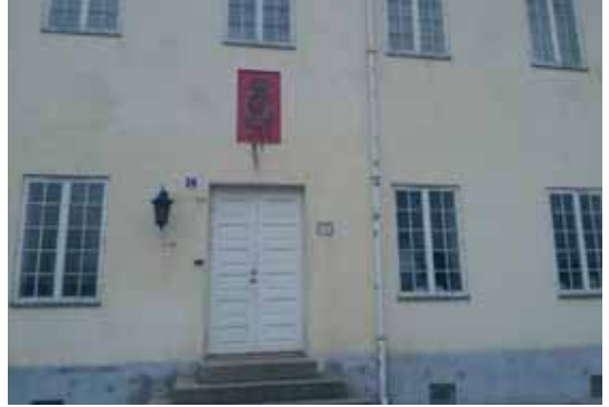
Brakkene på Karljohansvern er skiltet av selveste Karl 14. Johan

gammel militærbebyggelse oppført under Kong Karl 14. Johan - som de gamle veggsiltene på bygningene viser.