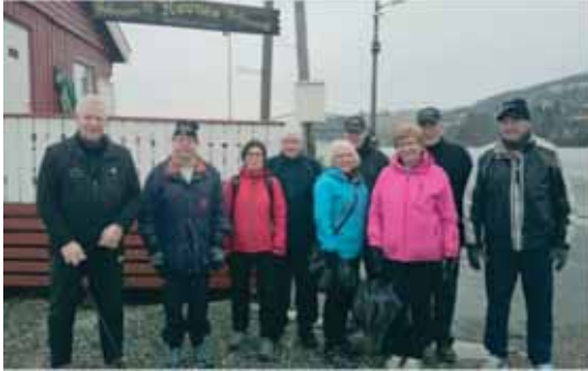
Fra åpningen av PV-97, 1. januar 2014.

Etter mange år uten turmarsj i Lillestrøm området var det mange som savnet noe her. Lottene hadde gitt seg, og PV'en på Skedsmokorset var nedlagt. Området rundt Lillestrøm egner seg godt til en PV runde, og det var bare å sette i gang å tenke ut hvor løypene kunne legges. Vi la vekt på at løypene ikke skulle være de samme som lottene hadde brukt, og at vi måtte unngå for mye asfalt.