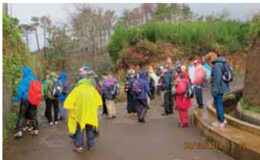
Her er regntøyet på

like mye som vi hadde gått ned, men det gikk det også. Vi skulle ha stoppet ved et Tee House, for å få litt å bite i, men dette var stengt. Matpakken kom frem etter hvert og rast ble det. Været ble mer ustadig og det var en del regn i luften nå. Men vi hadde jo en hindring igjen, igjennom en tunell. Vi var blitt oppfordret til å ta med lykt eller hodelykt så vi var forberedte. Men med min størrelse, var det litt av et pes dette her, men igjennom kom jeg og resten av gruppa. Regnet hadde satt seg nå og der var en våt gjeng som ankom Camacha, og fikk tak over hodet. En liten stopp her ble det, før bussen skulle gå, noe å tygge på samt litt å fukte strupen med. Må si det var godt å komme tilbake til hotellet. Var nok litt frossen kan man si men med en varm dusj så kommer jo varmen tilbake etter hvert. Etter en kald og frøsen dag, var det deilig med en tidlig kveld.