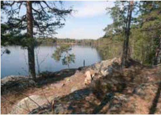
En av rasteplassene langs 6 og 11 km løypa.

Start er ved Dragsjøhytta som best kan betegnes som en sportshytta beliggende i et flott turterreng 5 km fra Årnes sentrum. Her avvikles ulike arrangementer hvor det bl.a. legges stor vekt på å ha et lavterskeltilbud til bygdas innbyggere. Men hytta leies også ut til brylluper, konfirmasjoner o.l. samt til møter for ulike foreninger.