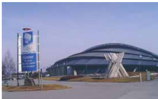
Fra Hamar Vandrerhjem

PV-29 var Furubergrunden, den er nå nedlagt, men PV 29 lever videre og heter nå Vikingskipet med start og mål ved Vikingskipet.