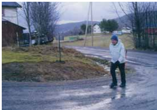
Full fart mot mål.