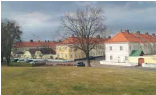
Brakkebebyggelsen på Karljohansvern. I dag populære sivile leiligheter.

med det karakteristiske klokketårnet. Gården hadde fergeprivilegier fra 1749 og eide datidens "Bastøferje". Vi går så over byens mest kjente badestrand, Vollen - eller "Vollane" på folkemunne. Så passerer Ekserserhuset fra 1862, som fra eksersis overgikk til et flittig brukt treningslokale før idrettshallen kom. Vi passerer gjennom "Brakkene" som er