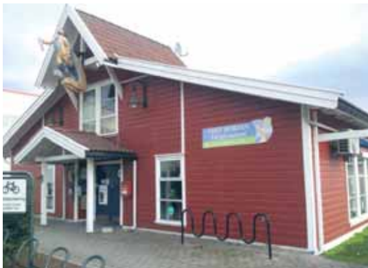
Løypa passerer turistkontoret, nabo av egen populær havne restauranten Fichland

6 km er nok mest populær de seneste årene men i den lengste løypa får deltagerne en fin utsiktsopplevelse oppe på Bassenget og Festningen, på "Hortens tak".