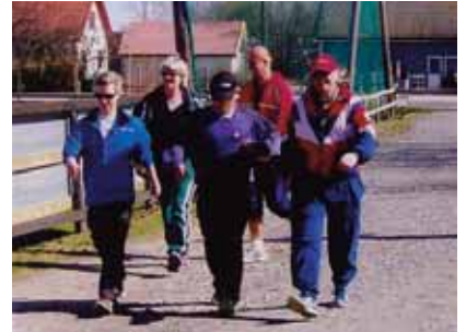
Mot mål i full fart.