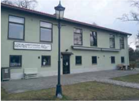
Lokalhistorisk Museum passerer på begge løyper.