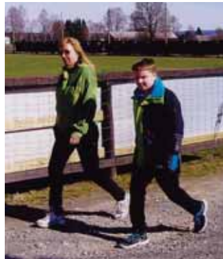
Den "yngre garde".