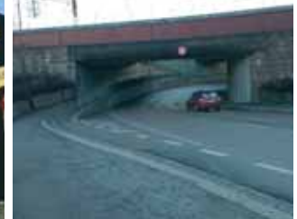
Jernbaneundergangen hvor Kongsvingerbanen og Eidsvoldbanen deler seg.

Mange turmarsjere ønsker også en kortere tur, så vi valgte å lage en 6 km. Valget var enkelt. For å vise fram mer av den vakre byen Lillestrøm ble kortløypa lagt i motsatt retning. Vi går langs Nitelva til vi kommer til jernbaneundergangen hvor sagbladet henger.