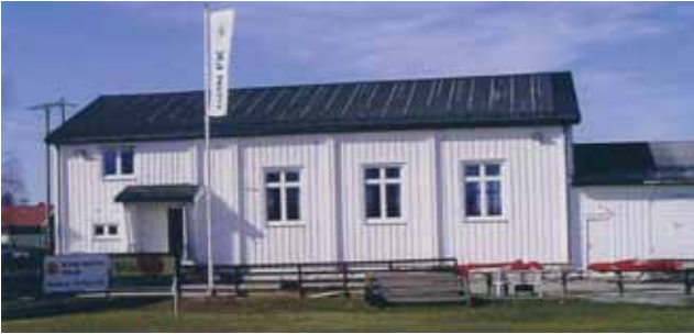
Bøn F.K. Klubbhus