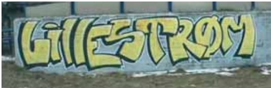
Fra åpningen av PV-97, 1. januar 2014.

Etter mange år uten turmarsj i Lillestrøm området var det mange som savnet noe her. Lottene hadde gitt seg, og PV'en på Skedsmokorset var nedlagt. Området rundt Lillestrøm egner seg godt til en PV runde, og det var bare å sette i gang å tenke ut hvor løypene kunne legges. Vi la vekt på at løypene ikke skulle være de samme som lottene hadde brukt, og at vi måtte unngå for mye asfalt.