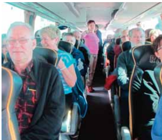
I bussen på vei til hotellet

Bare ordet Madeira, virker eksotisk, og det viste seg å være akkurat det. Da vi gikk ut og presenterte denne turen, var vi spente vi også. Førte stykker ville være med til denne fantastiske øya, noe vi var svært fornøyde med. Vi hadde en del møtevirksomhet i forbindelse med denne ruren, og vi kom frem til en fin tur, syntes vi. men det er jo deltagerne våre som avgjør dette. Fremmøte på Gardermoen gikk greit, og med alle å tilstede, var det bare å entre flyet. Turen nedover gikk greit, og vi landet i rute på Madeira. Til sol og cirka 20 grader var det bare å entre bussen å komme seg til hotellet.