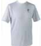
Lys grå - 1000