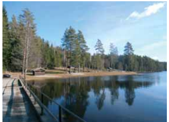
Flott badebasseng ved Veslesjøen langs 11 km løypa.

Hvordan finner du frem til oss? Vi antar de fleste kommer til oss via E16 fra Kløfta eller fra Kongsvinger-kanten. Kjør da E16 til Vormsund og ta av i rundkjøring ved ESSO-stasjon mot Årnes. Etter 5 km kjører du over Glomma og fortsetter gjennom rundkjøring og under jernbaneundergang. Fortsett rett