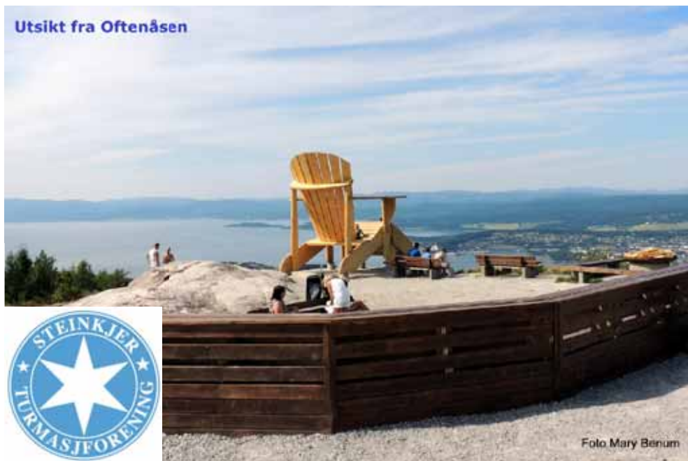
Utsikt fra Oftenåsen

For mer info: Steinkjer Turmarsjforening.no Eller: Turmarsjforbundet.no