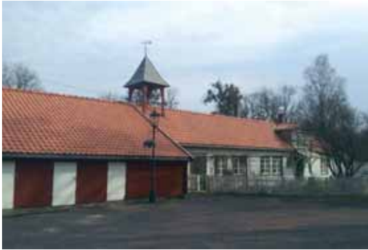
Horten gård som har byen sitt navn, inngår i løypa

I Tivoliveien passerer den "Røde hus", byens eldste bygning. Vi kommer snart til Horten gård som har gitt byen sitt navn,