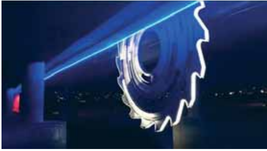
Sagbladet, ett vakkert skue om kvelden

Dette lyser opp med rødt og blått lys om kvelden. "Vakkert" Turen går videre langs Nitelva forbi kunstverket "The hammering man" og Lurkahuset hvor historielaget holder til. Her er det mulig å kjøpe kaffe og vafler på søndager om sommeren.