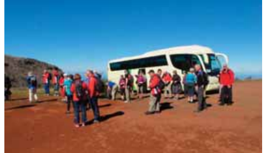
Ut av busse å på vei til Pico Ruivo

bussen med kurs for Pico do Ariero. Madeiras tredje høyeste fjell 1810 m over havet. Turen opp dit gikk greit, men underveis fikk vi vite at det hadde gått et ras i fjellet og stien vi skulle følge var dessverre ikke gangbar. Etter en del bilder av utsikten og nonnes dal, gikk så turen videre mot Pico Ruivo, forbi en liten by med navnet Santana og opp til en fjellstue. Her skulle vi