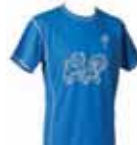
Blå - 1100