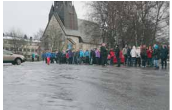
Kø også ved busstransport