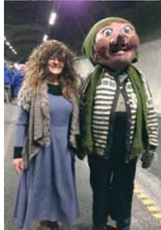
Grebbe Hangur og Trollmor