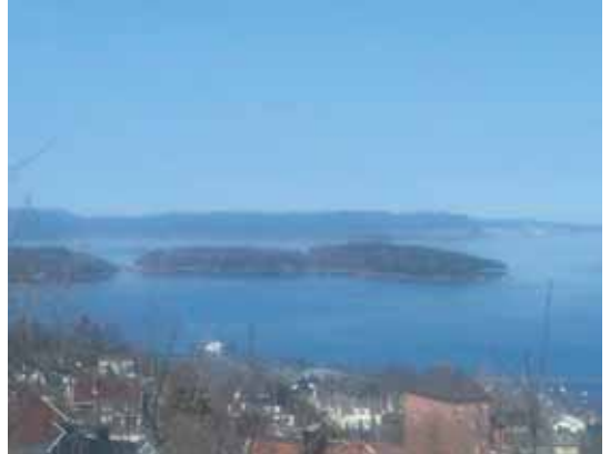
Mer av utsikten fra Bassenget. Her er Løvøya til venstre, så følger Mellomøya og Østøya.

fabrikken og gjennom bydelen Apenes, kjent for husene med de spisse gavlene, som ble bygget rundt 1920, for en stor del av ansatte i Marinen.