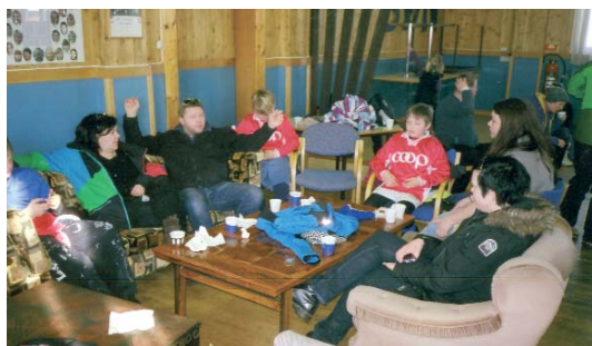
Etter marsjen en tur i "kosekroen".