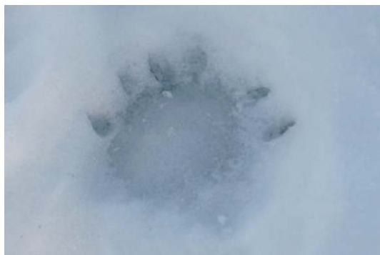
Gaupespor i mars 2012

I mars 2012 observerte vi to ganger gaupe- spor langs Andelva mellom Eidsvolds-