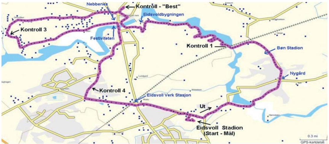
Kart over PV21 sommerløype 13 km

Nedenfor er gjengitt noen eksempelbilder som er tatt fra "Bilder som beskriver 13 km løypa" som finnes på Vandrelagets hjemmeside. Mange steder hvor løypa svinger er det tegnet inn piler på bildet som viser hvor man skal gå. Et eksempel på dette finnes nedenfor.