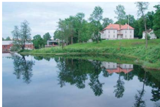
Eidsvoldbygningen ligger idyllisk til ved Andelva