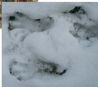
Beverspor i snøen ved Andelva