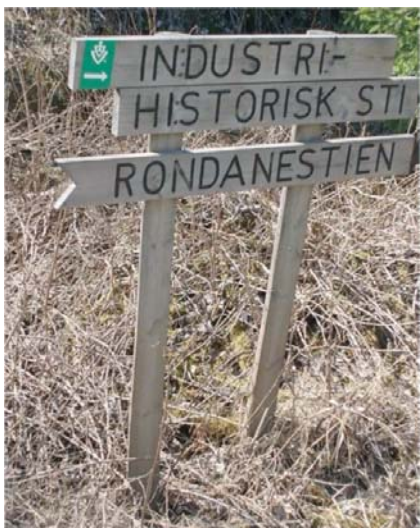
Vi vandrer på Industrihistorisk sti / Rondanestien

og Industrihistorisk sti. Se bilde. Langs elva er det gode muligheter for naturopplevelser.