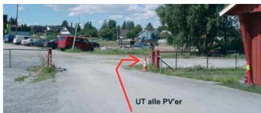
Pila viser at løypene svinger til høyre ut porten

kan man i snøen se beverens »akebakke« ned mot elva. Noen bilder som beskriver naturopplevelsen er også gjengitt. Svaner, Canadagjess, ender og andre fugler observeres stadig langs elva. Floraen langs elva er også verd å bli iaktatt. Første kontroll finnes ved elva. Varierende vær og lys-forhold gjør at en vandring langs elva byr på stadig nye opplevelser. Ca. midtveis i løypa er det kontroll ved bensinstasjonen "Best". Der kan man nyte en kopp kaffe med noe å tygge på i "Andelva Panorama" med utsikt utover en del av Andelva. Utsikten en dag i januar 2013 er avbildet nedenfor. Det er toalettmulighet på "Best". Alle løypene har kontroll inne på bensinstasjonen. Kontrollkortet stemples av personalet på stasjonen.