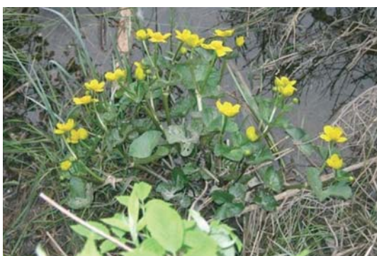
Bekkeblom – Soleihov ved Andelva

Vi håper at denne presentasjonen, og det du kan se på Hjemmesida vår, frister deg til å vandre på historiske stier i Eidsvoll. Vel- kommen skal du være!