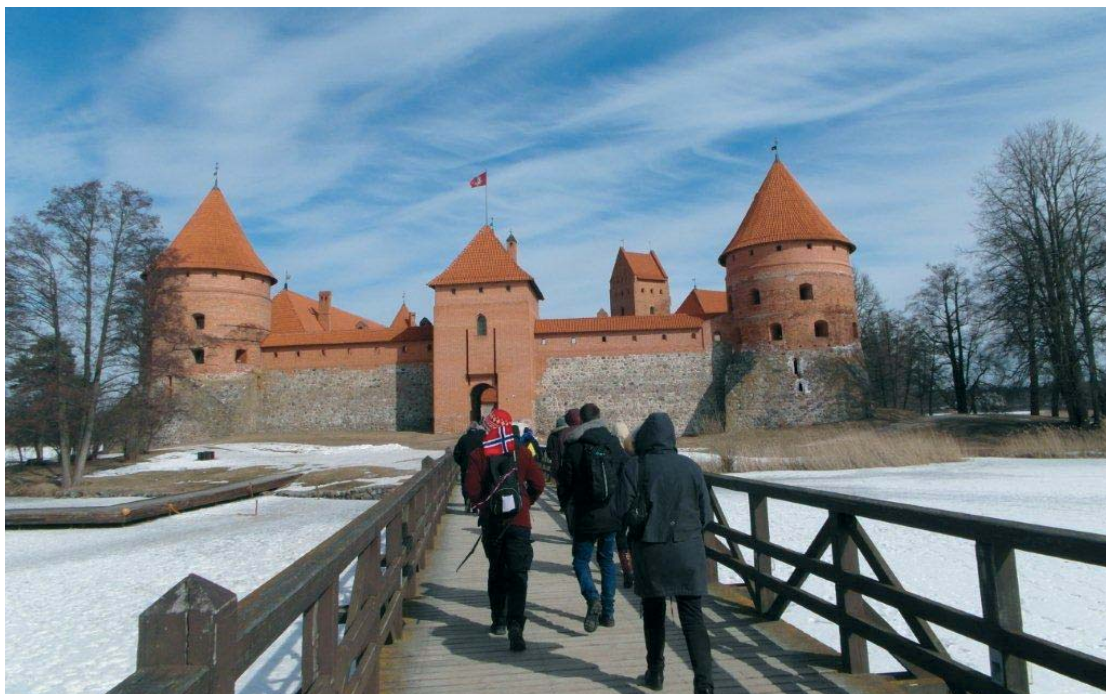
Ridderborgen i Trakai

Middagen denne kvelden var på egenhånd - men mange forsøkte seg på en restaurant med litauiske nasjonalretter - som bl.a. omfattet oppskårne griseører som snacks til forrett - det smakte helt utmerket.