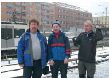
Disse 3 har alle Banemarsjene