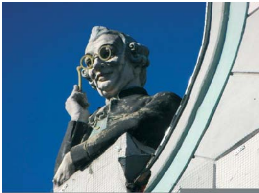
Mannen på taket