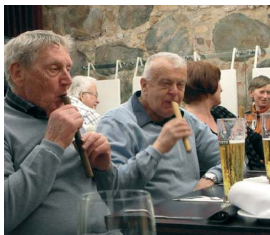
Glade musikanter i gamlebyen i Vilnius