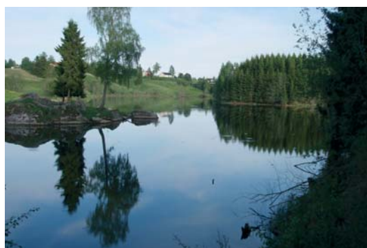
Ved Andelva finnes det mange flotte motiver

"EIF Vandrelaget utfordrer Rana-Runden, som hadde fleste deltagere i 2011, til å presentere sin PV".