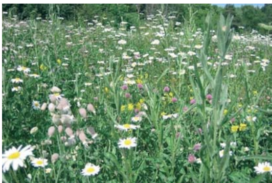
Blomsterprakt ved Andelva