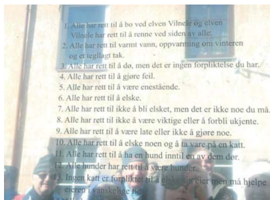
Grunnloven i fristaden Uzupis i Vilnius