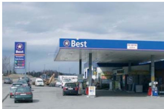
Alle løyper har kontroll inne på bensinstasjonen "Best" – hvor det er anledning til rast og WC-besøk

bygningen og Vengerfossen. Se foto nedenfor.