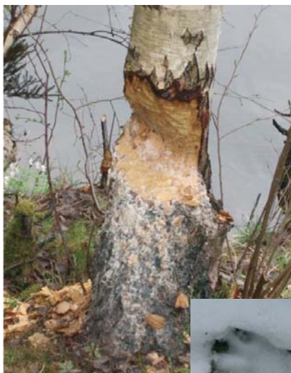
Her har beveren vært i aktivitet