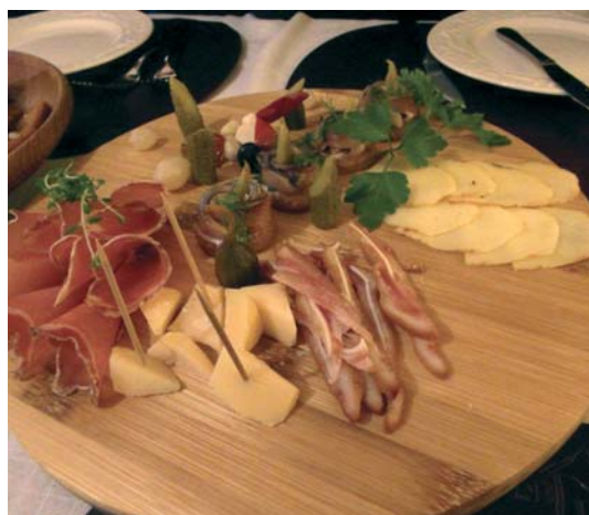
Litauiske nasjonalretter med griseører

Karaimene er et folkeslag fra Krim som slo seg ned i Trakai etter å ha gått i litauske fyrsters tjeneste på 1300-tallet og fremdeles bor etterkommerne deres i Trakai.