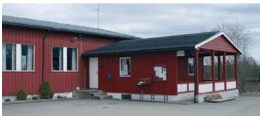
Startsted alle løyper ved EIF klubbhus, Råholt