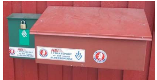
Kasse for startkort/løypebeskrivelser/stempler

Ved Andelva kan man følge med på beverens aktivitet. Det er vanskelig å se beveren, men stadig er det mulig å se nye trær som beveren har gnaget på, et eksempel på dette er avbildet. Om vinteren