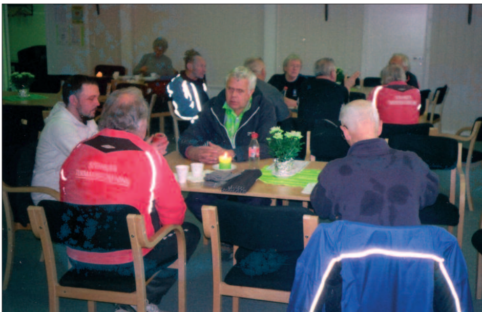
Og, så kommer det sosiale.