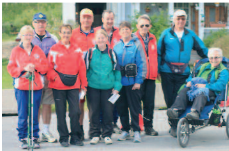
Fra åpningen 1. juni

Uansett du er velkommen til en trimtur i Odalen.