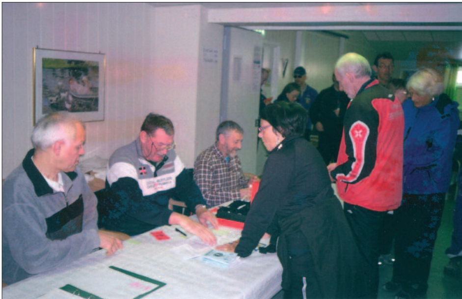
Her er det påmelding og stempling.