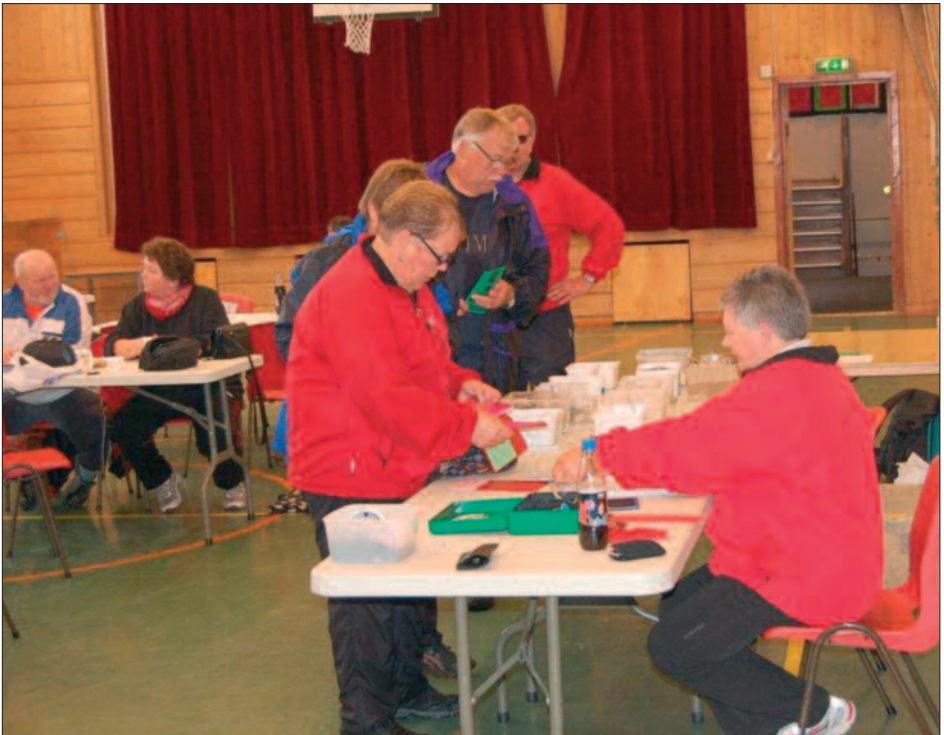
Fra Hadelandsmarsjen i juni 2012