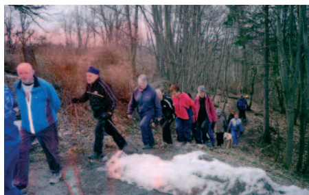
Like etter start, litt snø er igjen