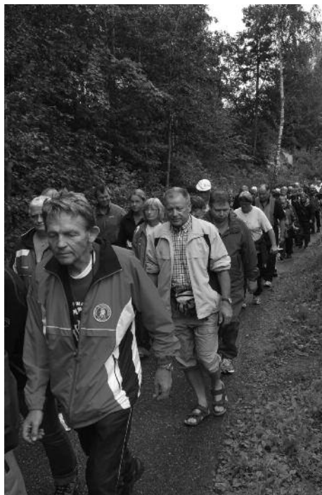
Fra Norgeslekene 2010

Søndag startet marsjen fra Lillehammer læringscenter, slik de gjorde torsdag og fredag. Denne gangen var det Lillehammermarsjen. Løypene var på 5, 10 og 22 km. De to lange var lagt forbi Sigrid Undset hjem Bjerkebækk. Sigrid Undset er modell på marsjens medalje. Vi gikk fem km