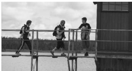
På Sjusjøen Rundt krysser vi over ei demning.