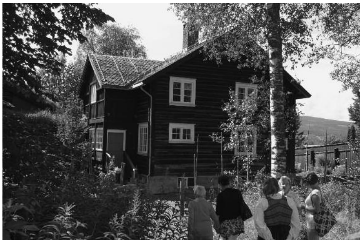
Bjerkebækk, hjemmet til Sigrid Undset.

Totalt ble det solgt ca 1500 startkort. Til å være første gang med Norgesleker er det flott. Så håper vi at Mo i Rana i 2012 klarer å få enda flere med.