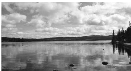
Fantastisk fin natur på Sjusjøen.

Diskusjonen var for og i mot ledermøter. Det var flere som deltok, men konklusjonen kan vel sies at å fortsette i nåværende form er uaktuelt. Det går for mye tid til "ingen nytte", og er i tillegg dyrt for turmarsjforeningene. Det ble hevdet at ingen saker ble sendt inn til