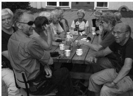
Folk drakk kaffe og koste seg i måloområdet på lørdag

arrangementene, men de var like blide hele tiden. Deltakerne smilte fra øre til øre og det kom mye skryt til de som jobba. Det er lenge siden jeg har hørt turmarsj blitt diskutert så mye som denne helga. Hva er lurt å gjøre for å få flere til å komme på marsjene? Det ble nok diskutert mest. Burde langløypa vært plassert på lørdag eller kanskje ikke? Burde det vært kortere tid mellom marsjene, eller lengre? Jeg håper diskusjonene fortsetter, og at noen kommer som skriftlige innlegg i Turmarsjnytt. Ett har vi allerede fått.