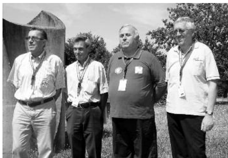
von links nach rechts

Vi fikk også presentert de økonomiske tallene etter OL. De hadde en total inntekt på 550 470 euro. Deltakeravgifter utgjorde 145 000 euro. Sponsorer bidro med 182 070 euro og de lokale myndighetene ga 204 500 euro. Andre inntekter som salg av effekter ga 18 900 euro. Så er det jo også spennende å se hva alle de pengene ble brukt til. Vi vet jo at avgiften til IVV er 5000 euro. Medaljer og annet til premier kostet 122 800 euro. Utgifter til reklame og trykking var 59 240 euro. Til reiser og overnatting gikk det 32 830 euro. De måtte betale 51 360 euro for møter, mat og selskaper. Utgiftene for leie av telt og lyd-systemer kostet 139 120 euro. Bussene kostet 58 500 euro. Syklene kostet 38 040 euro. Lønn til midlertidige ansatte kom på 20 810 euro. Til slutt de vanlige andre utgifter på 15 900 euro. De som er raske i hoderegning finner da ut at det gikk i pluss med 6 870 euro. En euro er vel verdt cirka 8 kroner.