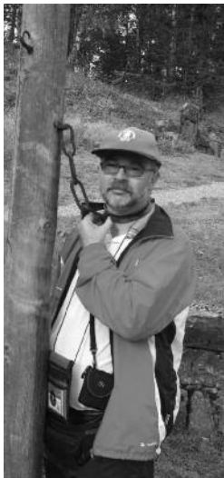
På Maihaugen satte redaktøren seg selv i gapestokk.

det bygd et flott hus med kafé, samlinger og kino. De ansatte tar med små grupper på omvisning inne i huset og i hagen. Vi ble fortalt ganske mye fra nobelprisvinnerens liv. En del var helt nytt for meg. Jeg må tilbake dit for å lære mer om den kloke damen. Vi fikk jo heller ikke tid til å besøke Aulestad.