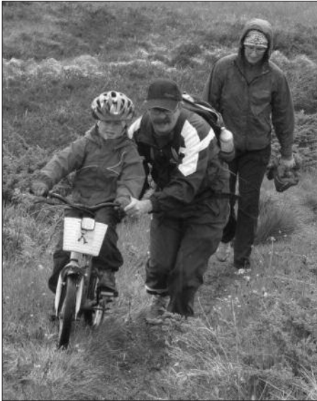
Hjelp fra Pappa

de må bæres. Å si at det var vått var ingen overdrivelse. Frøya ser ut til å bestå av mest stein, men innimellom er