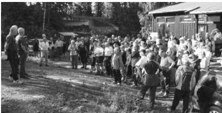
Meget stor deltakerflokk lytter til forklaringene om løypene på Norgeslekene

Etter min mening er det mange uavklarte ansvarsforhold forut for eventuell søknad om OL kan leveres. De viktigste er vel arrangementsavtale med arrangørsted, arrangementsansvarlige og økonomiske avtaler. Var disse klare forut for ledermøtet? Og i tilfelle hvorfor ble de ikke presentert? Jeg vil anbefale og støtte et skikkelig utarbeidet forslag til TURMARSJ-OL i Norge. Hvis jeg ikke husker feil, så er det ikke lengre siden enn under forbundstinget i fjor (Arendal 2009) at eventuelt arrangement av OL i Norge ble diskutert, og ble avist, bl a på grunn av økonomi. Underforstått så er dette, OL i Norge, en forbundssak. Eller tar jeg feil? Hva er det som gjør at Forbundsstyrets president, i år, kan anbefale at NTF skal søke om OL i 2013? Hvilke skriftlige avtaler forelå forut for presentasjonen, og hvem har godkjent/underskrevet den/disse? Hvem har lov til å bestemme