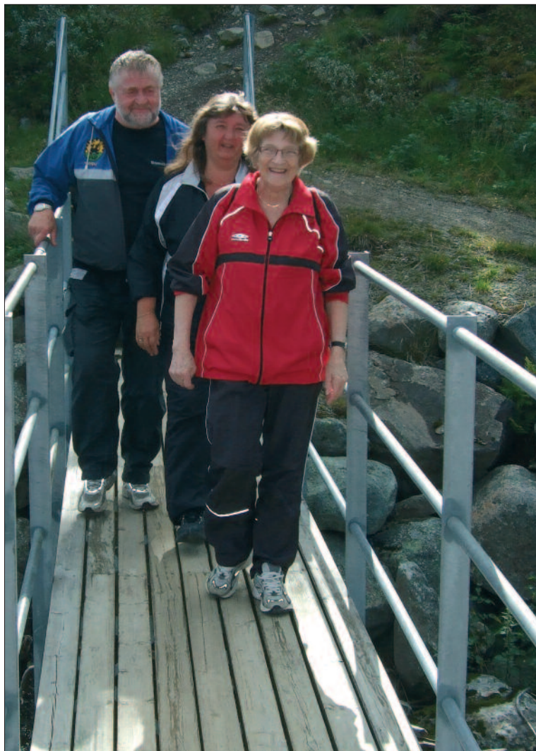
Norgeslekene 2010: Happy Times In Lillehammer