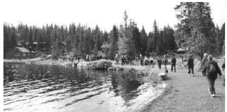
Fra starten på Sjusjøen Rundt.