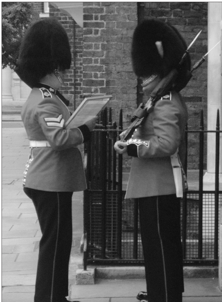
Kjente "figurer" i London.

Jeg hadde hele dagen til disposisjon, og det trengtes. Det tar ofte litt tid å finne frem. Beskrivelsene var bra, men de bruker av og til ord og uttrykk, som jeg ikke er så familiær med. Men tar man seg tid så går det bra. Alle rutene kan man finne på internett. Der finnes beskrivelsene og kontrollspørsmålene. I beskrivelsene står det angitt hvilken undergrunnsstasjon du starter fra og hvor du avslutter. De har ikke noe stempelsystem på stedet, og siden klubbene ligger langt fra vandringsene, så er det to måter å løse det problemet på. Enten sender man stempelskortene sammen med kontrollspørsmålene, og startgebyr, og får kortene stemplet i retur. Selv foretrekker jeg å sende kontrollspørsmålene og penger og ber om å få gratiskort (free supplementary insert card) tilbake og får forbun-