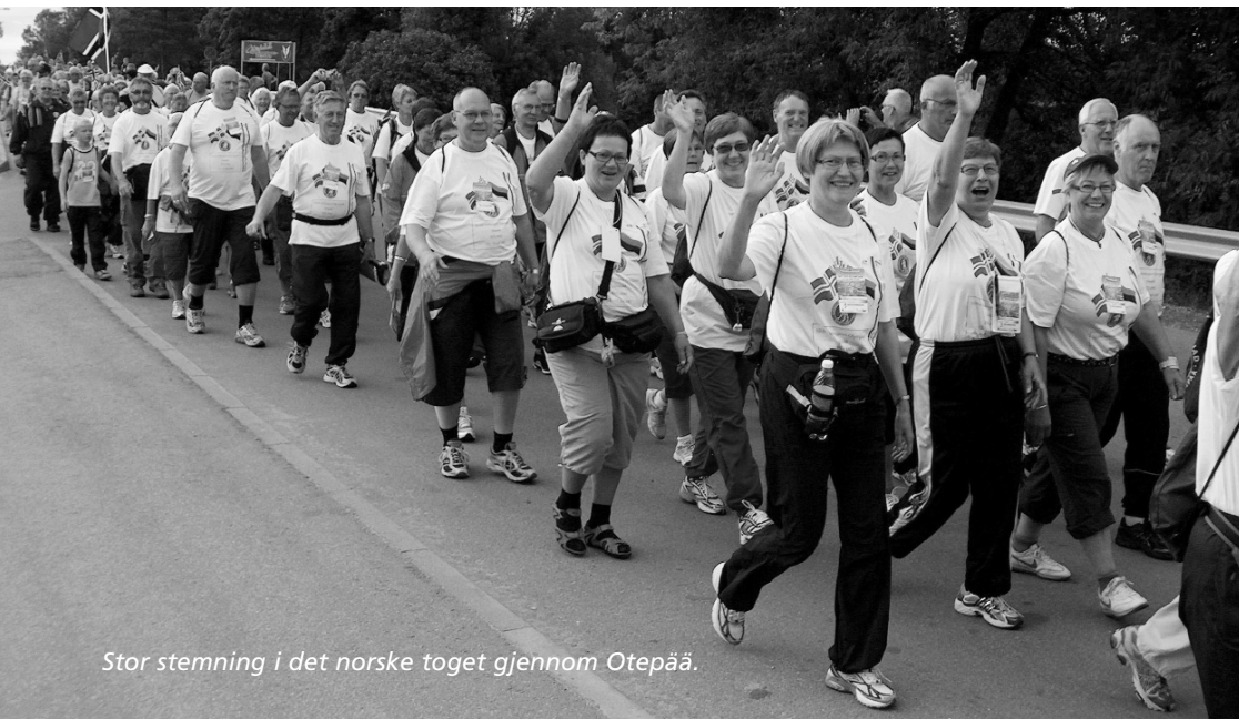
Stor stemning i det norske toget gjennom Otepää.

Fremme på hotellet fikk vi opplyst at den siste kofferten var funnet og var på vei til en glad eier. Vi fikk servert en gedigen lunsj som lignet mer på full middag. Senere på dagen var det omvisning i selve Tallin. I gamlebyen har de tatt vare på de historiske bygningene i et stort område. Dette var fantastisk å