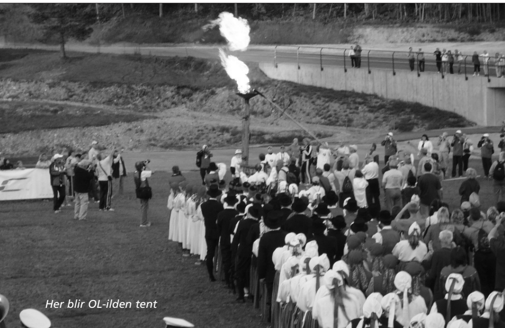
Her blir OL-ilden tent

ønsket det. Vi reiste med Estonian Airlines som er delvis eid av SAS. Det var god service på flyet og folkene snakket engelsk. Her kunne vi betale med nesten alle typer valuta og bankkort.