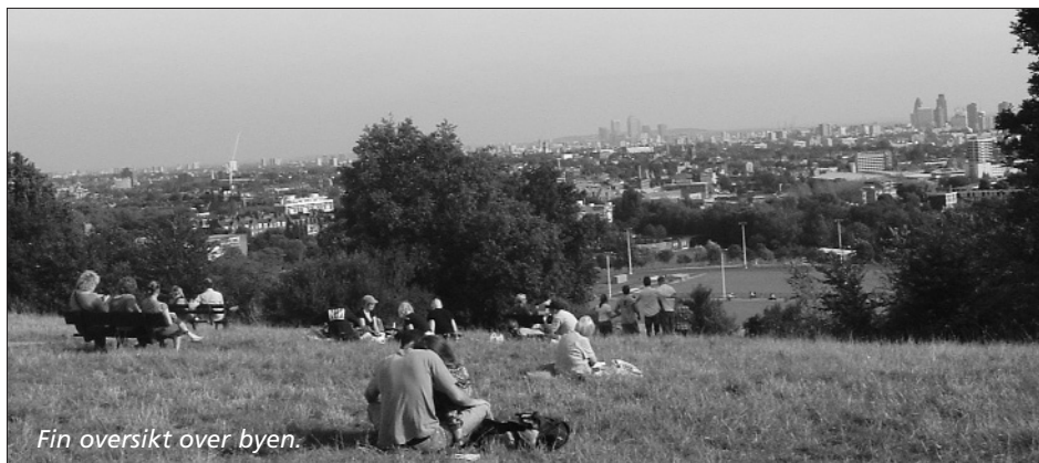
Fin oversikt over byen.

et par helt i ytterkanten. Det er nok å velge mellom. Hør bare: Pilgrim trail, South Bank Trail, Westminster and City of London, Royal London Trail og flere. Etter å ha vandret et par av de i sentrum, satte jeg pris på en av de i utkanten, nemlig ute i Hamstead. Jeg tok undergrunnen så langt jeg kunne og så var jeg i Hamstead. Etter å ha vandret i små stille gater i byen, havnet jeg i et nydelig parklignende område, nemlig Hamstead Heath. Dette stedet var en gang i tiden en øde hede, nå er det en forstad til London. Dette er faktisk det høyeste punktet i London. Derfra har du utsikt til det meste av London. Det var avslappende å vandre rundt i slike områder, etter å ha vært inne i sentrum av byen i