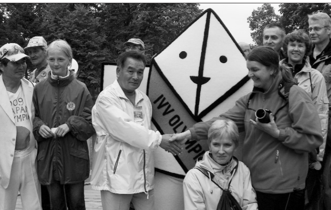
Den alltid tilstedeværende maskot for OL i Japan og en av deres ambasadører.