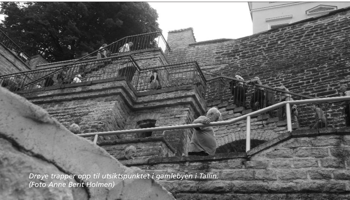
Drøye trapper opp til utsiktspunktet i gamlebyen i Tallin.