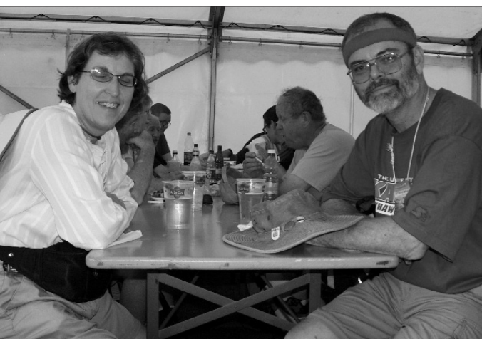
To folkesportere fra Kansas i USA. Vi snakket mye sammen i løypa og utvekslet mail-adresser.

selv føre på km. Da vi kom til spa-hotellet ble vi møtt med et flott fyrverkeri i kveldsmørket.