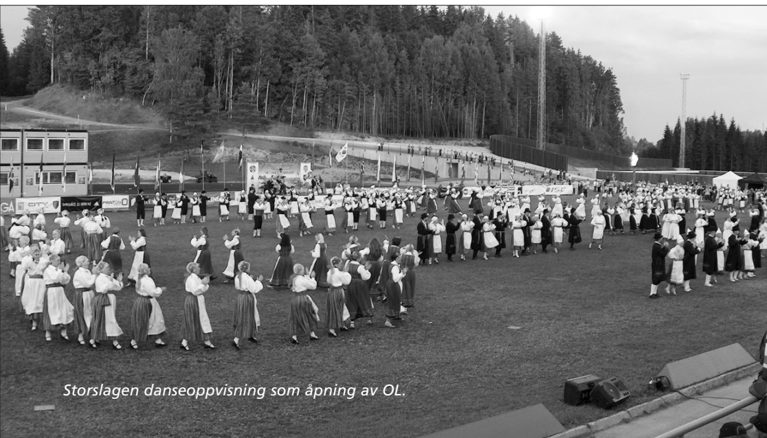
Storslagen danseoppvisning som åpning av OL.

500, alle i godt humør, smilende og syngende. Det vakte oppsikt og vi ble tiljublet fra de som sto og var tilskuere. Selv for en lærer med mange års erfaring fra å gå i 17. mai-tog ble dette spesielt. Dette kan ikke forklares, det må bare oppleves. Fremme på stadion hadde andre nasjoner stilt opp og de ble overrasket over det lange toget fra Norge. Vi fikk spørsmål om det var flere igjen hjemme. Åpningsseremonien hadde mange taler på estisk, engelsk og tysk. En eldre person og en ungdom tente ilden sammen. Deretter fikk vi se en forrykende flott oppvisning av folkedansere. Etter denne seremonien var det start på en 6 km kveldsvandring fra stadion til spahotellet. Ingen kontroller og IVV-stempling forgikk i ekspressfart. Her måtte vi