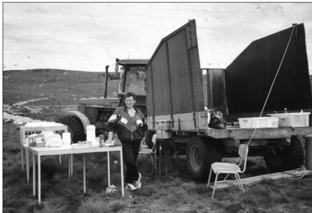
Traktor kan brukes til så mangt.

sommerbeite. Det var rene idyllen, spør du meg.