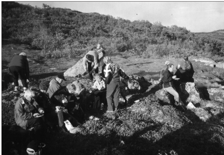
Grilling lørdag kveld.

at det ble en fin og sosial tur! Takk også til bussjåføren fra Brustad for en trivelig og behagelig tur!