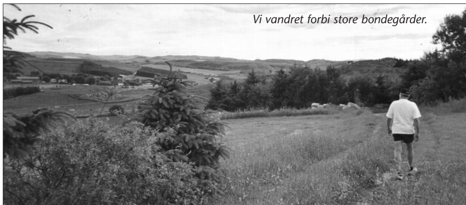
Vi vandret forbi store bondegårder.

Veien gikk stadig oppover, og vi ble både varme og slitne der vi gikk oppover åsen. Endelig kunne vi se konturene av Steinkjerringa i det fjerne, og der var det også rasteplass. Det skulle bli godt med en liten pause, men ennå var det stykke å gå. På avstand så rasteplassen ut som et Underlig hus. Da vi kom nærmere så vi at det var en traktor med tilhenger som fungerte som utsalgsbod der oppe. Der var et orginalt påfunn, og det fungerte utmerket. Det var salg av kaffe, kaker, brus og pølser. Stoler var også plassert ut, slik at vi kunne ta oss en velfortjent hvil. Rundt omkring gikk sauer og storfe på