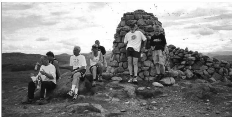
Fornøyde turmarsjere ved Synesvarden.