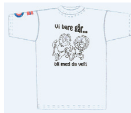
T-SKJORTE hvit kr. 100,-