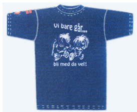
T-SKJORTE marineblå kr. 120,-