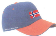
CAPS kr. 105,-