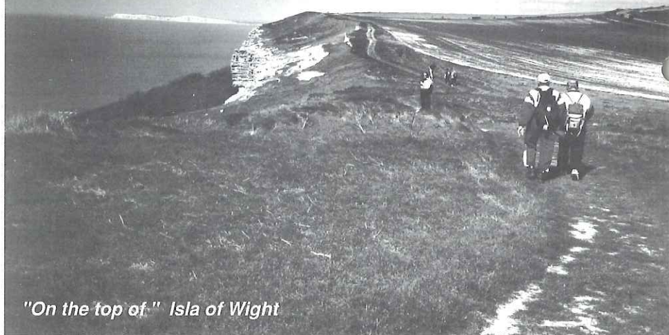
"On the top of" Isla of Wight

Rasteplassen var ganske enkel, bagasjerommet i en bil på en parkeringsplass. Der fikk vi kjeks og saft. Det var standard på alle rasteplassene.