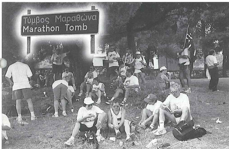
Rasteplass i maratonløypen

tet en buss som kjørte oss til hotellet i Solomousgate 72. Standarden var ikke etter norske forhold, men senga var ren og så hadde vi egen dusj. (Det har vi ikke hatt på tidligere OL). Så var det og finne en plass og spise, personlig så havnet jeg + noen til i den gamle bydelen og der var det nok av «innkastere» til spiseplassene så mat ble det, lam på gresk. Torsdag dro vi på sightseeing med buss og guide i sentrum. Det vi bl.a fikk se var Parlamentet, slottet hvor Konstantin bodde før han ble styrtet, Papandreous's residens, historisk mu-