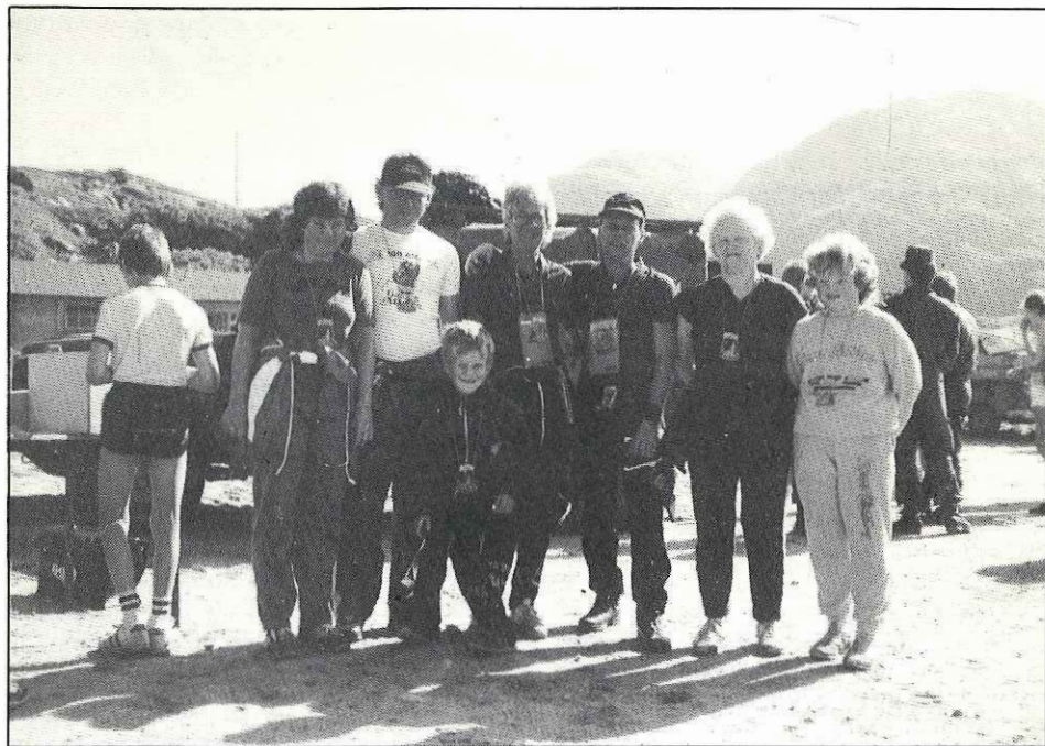
En fornøyd familie på vei til Ishavet.