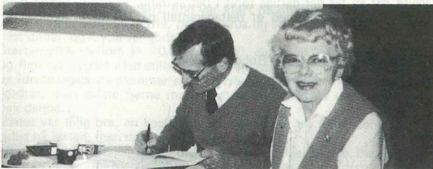
Vertskap i Trondheim: Byåsen IL

Forbundsstyret har også i år deltatt i regionsmøter rundt omkring i landet, og vi ser her noen glimt fra Trondheim.